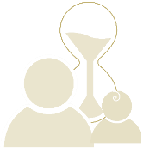
Tidiga samordnade insatser för att främja hälsa och förebygga ohälsa