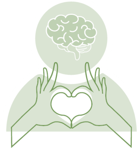
Fysisk hälsa vid psykisk ohälsa/sjukdom