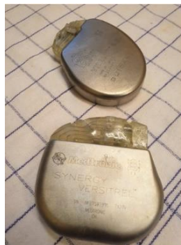
Medtronic defibrillator (ICD)