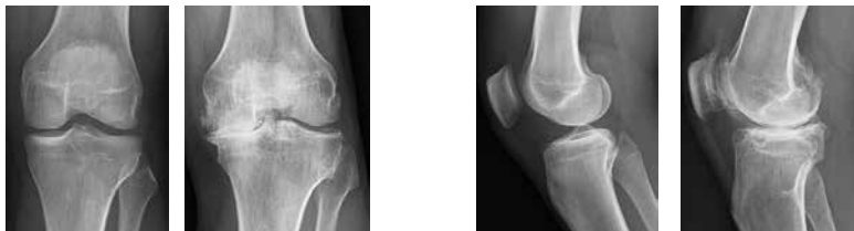
Frisk knä, främifrån

Diagnosen bekräftas med vanlig röntgen. Magnetkameraundersökning (MRT) och artroskopi (titthålsoperation) kan ge kompletterande information men är sällan nödvändig.