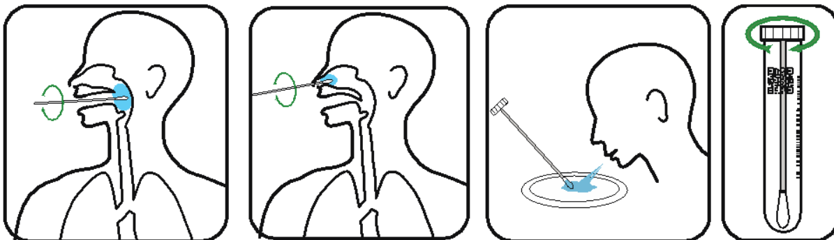
1. Uzimanje brisa sa zida ždrijela 2. Uzimanje brisa iz nosa 3. Pljunite i umočite 4. Zavrnite