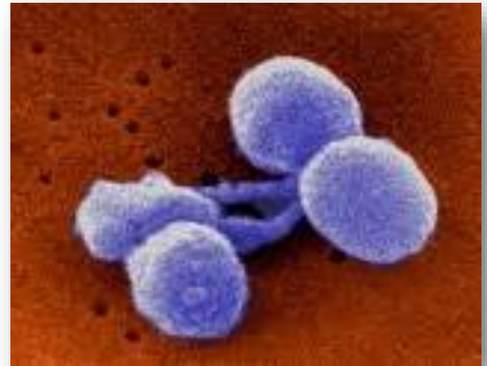
Streptococcus pneumoniae – en diplokokk