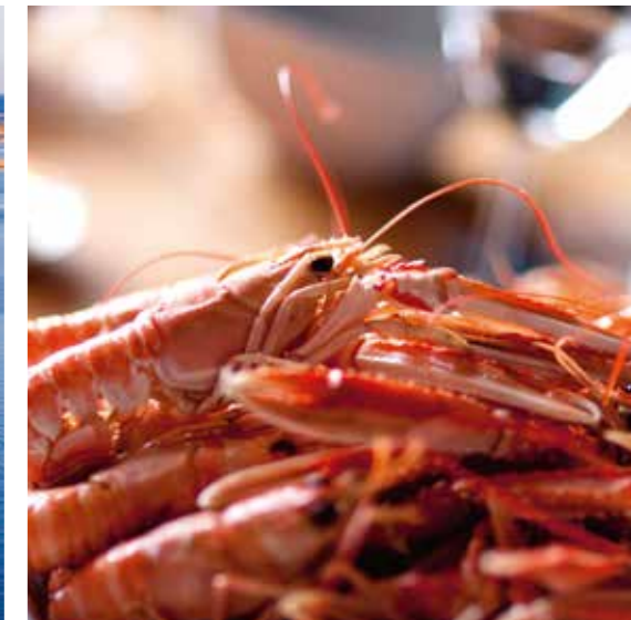
Havskräftor är ett av Bohusläns marina livsmedel i absolut toppkvalitet.