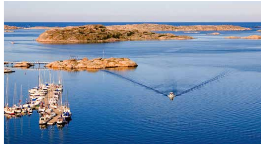
Bovallstrand. Maritim turism är ett av de viktigaste maritima utvecklingsområdena.

Engagemanget har lett till att de samverkande parterna har utökats från VGR, GU och Chalmers till att även omfatta Sveriges Tekniska Forskningsinstitut (SP) samt SSPA Sweden AB (marintekniskt institut/konsultbolag som ägs av Chalmers stiftelse). Havs- och vattenmyndigheten deltar också arbetet med att stärka klustret, liksom Länsstyrelsen i Västra Götaland. Fler parter kan tillkomma som "huvudmän" för maritima klustersatsningen. En första utvärdering ska göras när de prioriterade områdena varit föremål för dessa kraftsamlingar för innovation under två år, dvs. under 2015-2016.